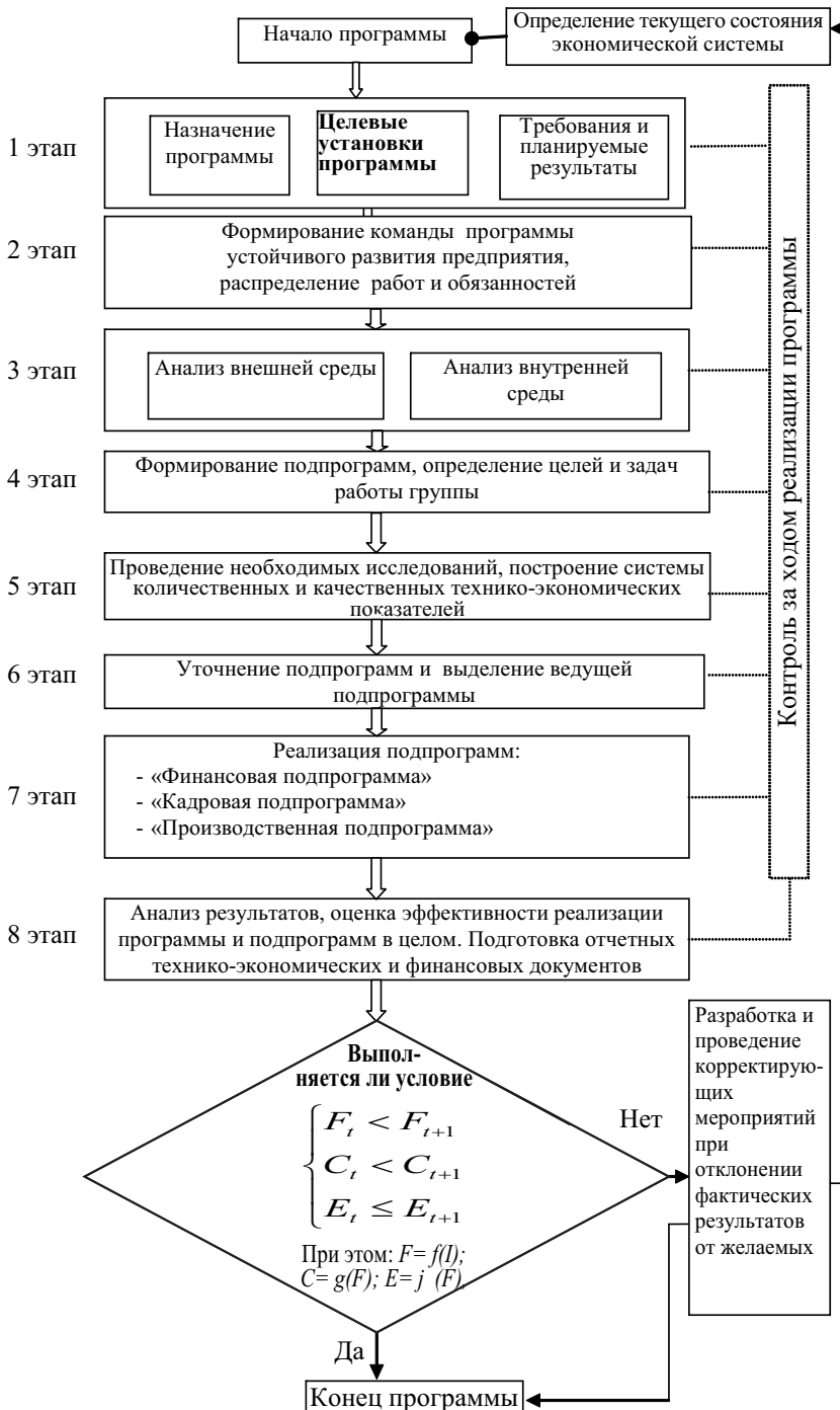
Рис. 1 – Программа стратегического планирования развития экономических систем

Алгоритм процедуры стратегического планирования на предприятии в области инноваций начинается со сбора результатов оценки восприимчивости предприятия к инновациям. Она пред-