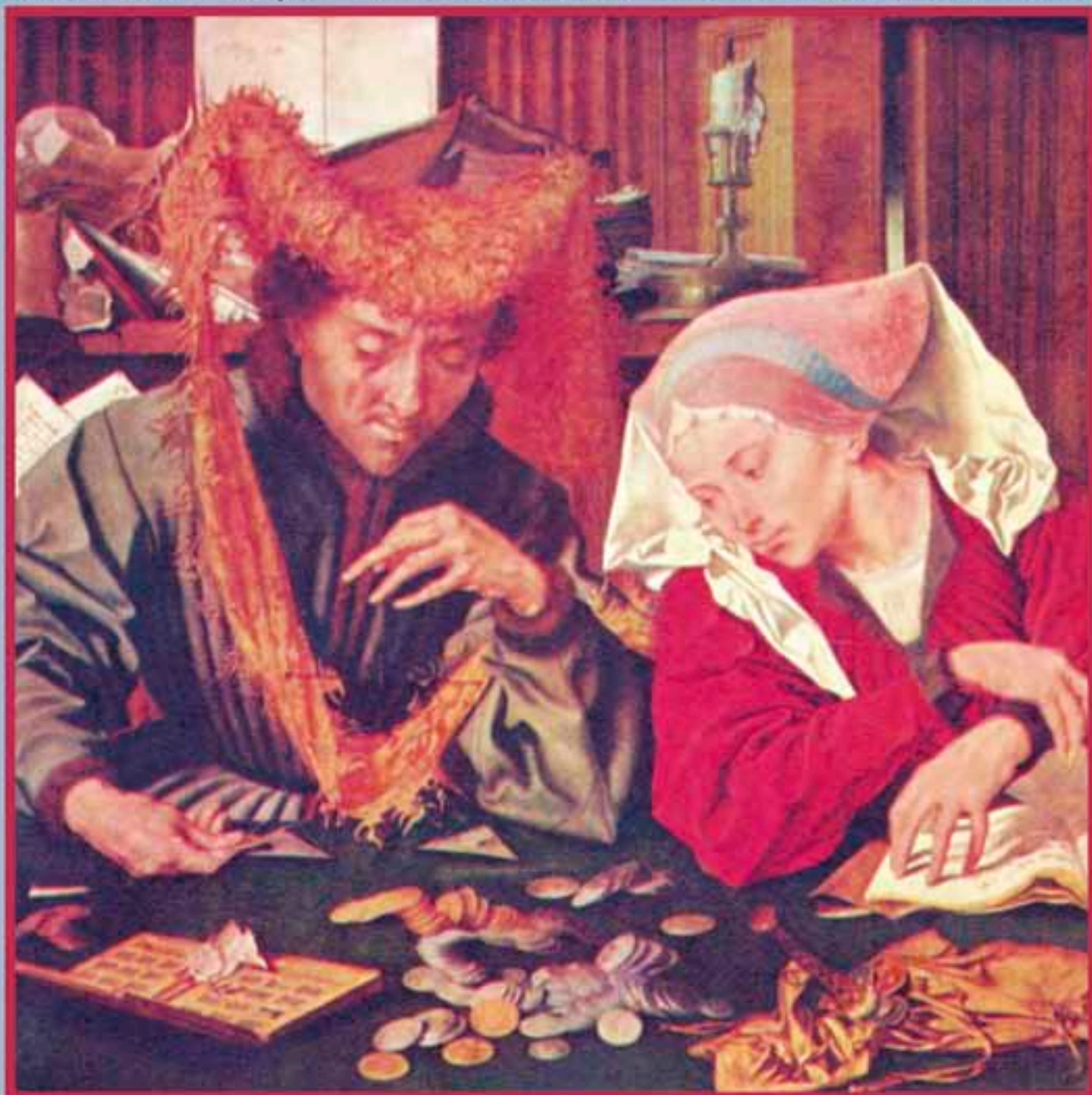
МАРИНУС ВАН РЕЙМЕРСВАЛЕ. СБОРЩИК ПОДАТЕЙ СО СВОЕЙ ЖЕНОЙ. 1539 Г.

СЕРИЯ «ИННОВАЦИОННАЯ ЭКОНОМИКА: ЧЕЛОВЕЧЕСКОЕ ИЗМЕРЕНИЕ»